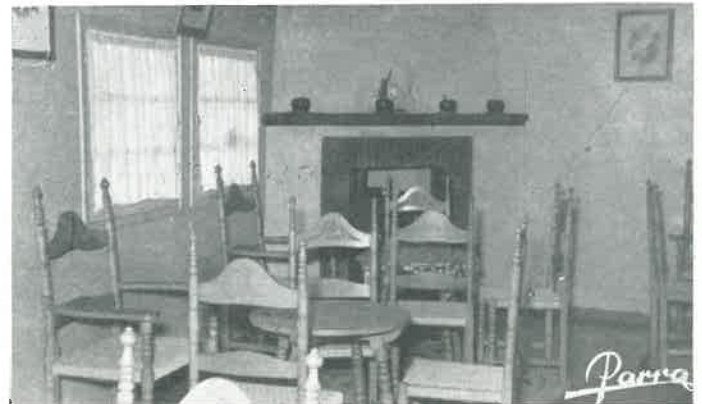
Un rincón del local que el Club dispone en el campo de aviación.