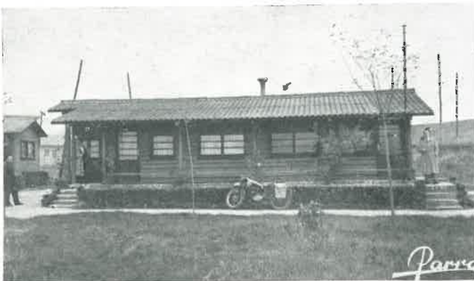
Edificio en el Aeródromo de Vitoria, utilizado por el Aero Club.

8.º Gonio. — Edificio destinado a la instalación de radiogonometría, de construcción reciente, en el que se encuentra instalado dicho aparato con todos los servicios necesarios.