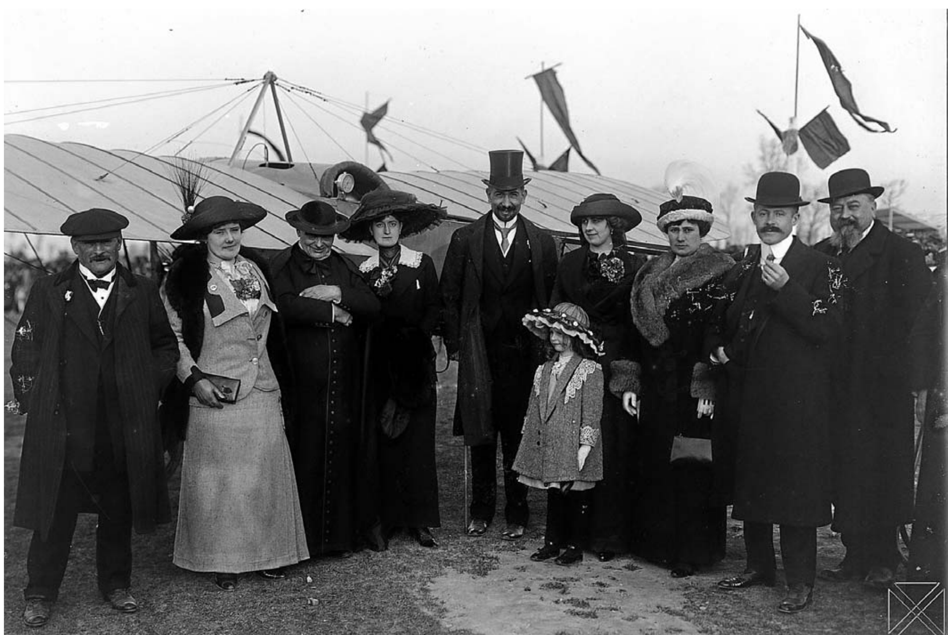
Autoridades y curiosos en la inauguración de la escuela de pilotos Garnier en el campo de Lakua en 1913.