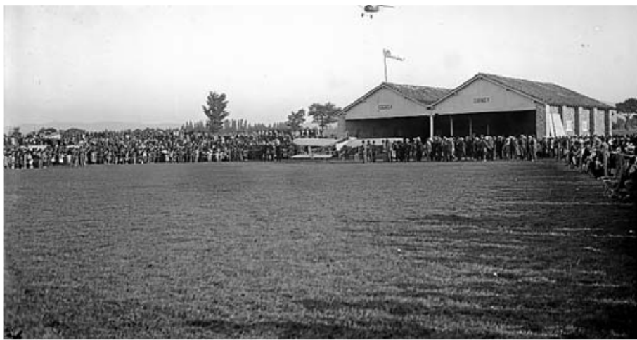
Otra imagen de la apertura de la escuela Garnier en Lakua. :: GUINEA AMAVG