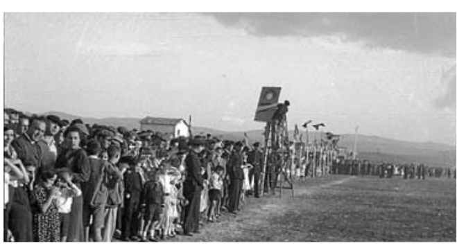
Inauguración del aeródromo de Salburua en 1935.

ropuerto en memoria del general golpista. Cada vez que nacía una compañía o se abría una nueva línea de Vitoria con alguna ciudad, se festejaba como un gran acontecimiento. Así fue cuando un Bristol 170 de Aviaco, con capacidad para 56 pasajeros, inauguró la línea Madrid-Vitoria en julio de 1952.