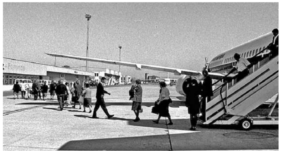
Primeros vuelos en el aeropuerto de Foronda.:: EL CORREO

bre de 1935. Toma el nombre de José Martínez de Aragón, un piloto alavés que realizó el primer 'looping' o giro vertical de 360 grados, que había impulsado el aeródromo y murió en un accidente de aviación poco antes de su puesta en marcha.