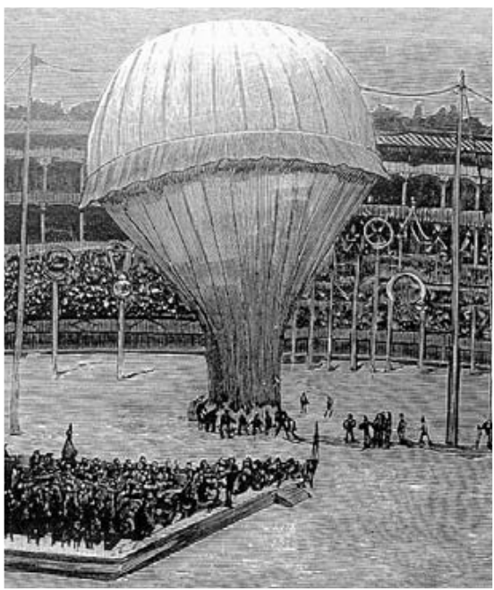
Dibujo que recoge un vuelo de Milá.